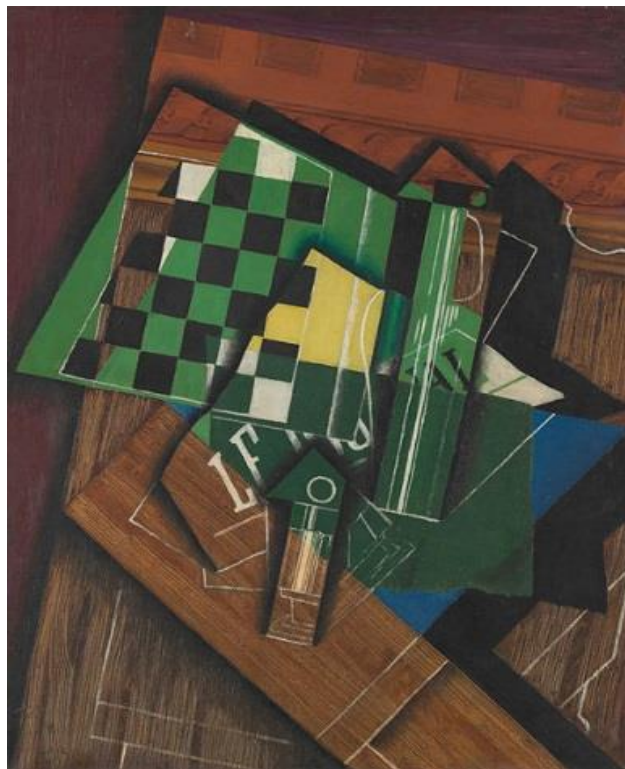
(شکل ۴) خوان گریس. صفحه شطرنج. ۱۹۱۵ (رنگ روغن روی بوم)

با ظهور هنر مدرن، در فضای ادبی نیز تحولاتی اساسی صورت می‌گیرد که ما در آثار نویسندگانی چون مارسل پروست (Marcel Proust)، جیمز جویس (James Joyce) و... شاهد آن بوده‌ایم. اما این پژوهش با انتخاب یکی از هنرمندان معاصر قصد دارد به واکاوی آثار ادبی گونتر گراس بپردازد. در میان نویسندگان معاصر، گراس نگارنده شهیر آلمانی شناخته شد که با ایجاد تحول زبانی در سبک‌های جدید رمان‌نویسی مطرح گردید. نویسنده‌ای خلاق که با مجموعه آثار خود در زمینه شعر، نمایش‌نامه، رمان و همچنین نقاشی، جنبه‌ای نوآورانه به عرصه ادبی