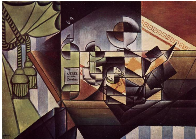
(شکل ۳) خوان گریس. طبیعت بی جان. ساعت، بطری. ۱۹۱۲. کوبیسم تحلیلی