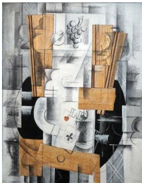
(شکل ۲) ژرژ براك. ظرف میوه. ۱۹۱۳. (رنگ روغن، گواش و زغال روی بوم)