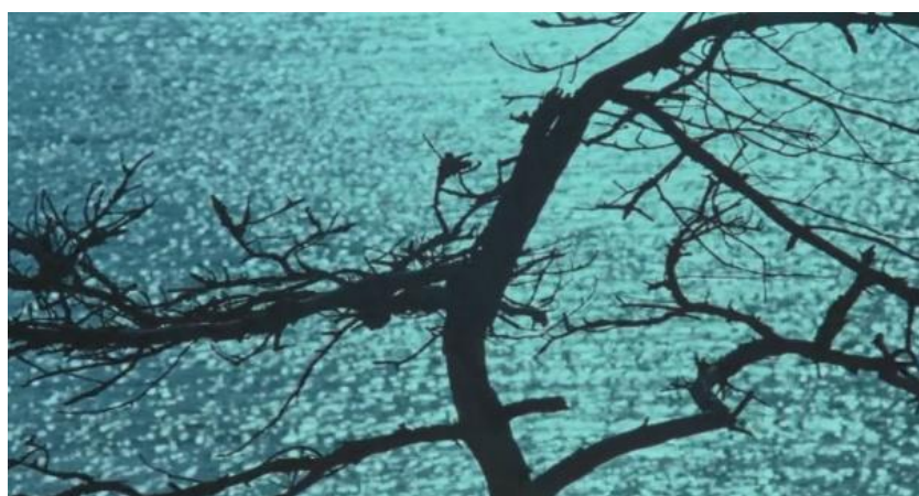
شکل ۶. سکانس پایانی فیلم ایتار