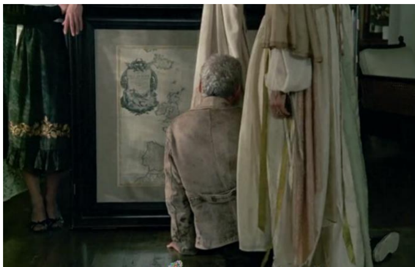
شکل ۵. ظواهر مانع دریافت حقیقت