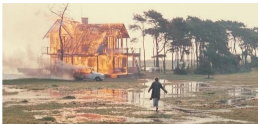
شکل ۷. به سوی آرامش؛ سکونت در جهان بیرونی محقق نمی‌شود