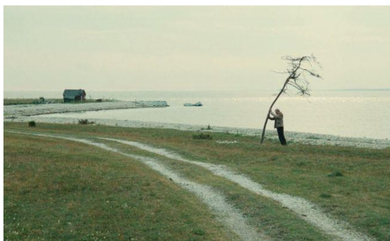
شکل ۲ و ۳. تصویر درخت خشک؛ همیشه برای رشد درخت؛ نور و آب و خاک کافی نیست