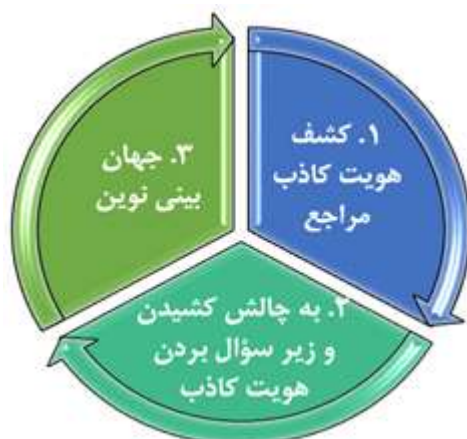
شکل ۱. فرایند سه مرحله‌ای الگوی مطلوب