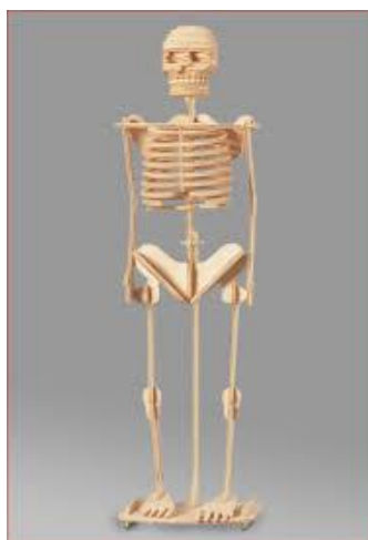
تصویر شماره ۵: تصویر یک اسکلت چوبی ۱