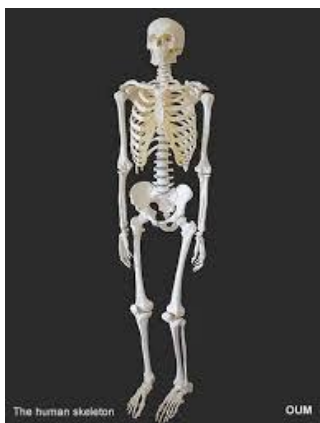
تصویر شماره ۴: تصویر یک اسکلت واقعی ۲

به دیگر بیان، بنت پیشنهاد کرد که هر چه کاری که خالق یک سیستم برای تولید آن به انجام رسانده است بیشتر بوده باشد، عمق منطقی سیستم تولید شده، یعنی میزان اطلاعات مندرج در آن مرتبط با نوع کار انجام شده، بیشتر خواهد بود. مثال ذیل نکته مورد نظر بنت را بهتر توضیح می‌دهد. شکل‌های ۴ و ۵ تصاویر یک اسکلت واقعی و یک اسکلت چوبی را که به عنوان مدل برای آموزش به کار می‌رود، نمایش می‌دهند.