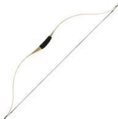
تصویر شماره ۶: تصویر کمان رومی ۱

آیات فوق اشاره به رویدادی رازآمیز دارند که بر سر کیفیت آن میان مفسران و مترجمان (چنان که از دو ترجمه بالا مشهود است) اتفاق نظر وجود ندارد. آیه نهم در میان آیات فوق بخصوص از این جهت حائز اهمیت است. بسیاری از مفسران و مترجمان «قاب قوسین» را به گونه‌ای تفسیر و ترجمه کرده‌اند که گویی در صحنه‌ای که در آیات بالا (به صورت ظاهری) توصیف می‌شود، فرشته وحی (جبرئیل) و پیامبر (و یا خدا و پیامبرش) رویروی یکدیگر در فاصله دو قاب یک کمان یا اندکی نزدیک‌تر قرار گرفتند و وحی به پیامبر القاء شد. حال آن که برخی دیگر از مفسران با توجه به شکل کمان رومی (تصویر ۶) بر این نظرند که ملاقات میان فرشته وحی و پیامبر (یا خدا و پیامبرش) در میانه «قاب قوسین» صورت گرفت و نزدیک‌تر شدن بیشتر آن دو به یکدیگر اشاره به نوعی اتحاد وجودی و تجربه زیسته است که در آن انتقال وحی به وسیله کلمات و مفاهیم صورت نگرفته است.